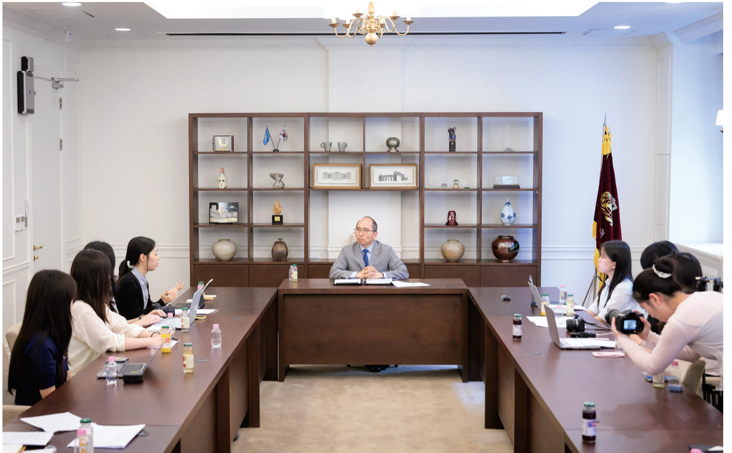
김 총장은 "그동안은 성과를 만들기 위한 틀을 구축하는 시기였다고 생각한다"며 "앞으로의 과제는 교육 혁신, 연구 혁신을 통해 우리가 원하는 탑 티어 대학으로의 도약"이라고 밝혔다.

좀 더 체계적이어야 할 필요가 있었기 때문이다. 학생 수준을 더 높이기 위해 입학 요건인 토픽 급수를 더 높인 적도 있다. 학생 수도 중요하지만 이제는 양보다는 질이 더 중요하다고 본다. 교육에 대한 높은 수준의 성취 역량이 중요하기 때문에 교육 프로그램을 강화하고 있다. (이하는 문병원 총장 행정실장의 추가 설명) 코로나 시기 온라인 강의를 진행하다 보니 유학생 수가 늘었다. 그 학생들이 코로나 시기가 지나고 졸업을 하면서 자연스럽게 숫자가 줄어들었다. 정부에서도 여러