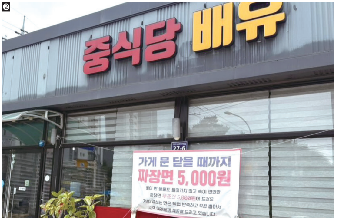
① 5일 기준 거지맵에는 서울캠 인근 23곳, 국제캠 일대 3곳의 식당이 등록돼 있다. ② '중식당 배유'의 배준우 사장은 "가게 문을 닫는 날까지 짜장면 가격 5,000원을 유지할 계획"이라고 밝혔다.

심 사장은 "학생들이 편하게 찾을 수 있는 밥집으로 기억되길 바란다"며 "특별한 음식을 파는 곳이라기보다 누구나 부담 없이 와서 식사할 수 있는 공간이 되는 것이 목표"