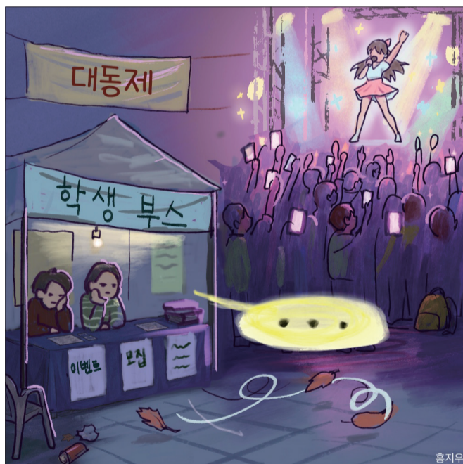
만평 지워진 대동의 의미

빌려온 화려함에 머무르기보다, 우리가 주체가 되어 참여를 만들어 가야 한다. 함께 모여 하나 되는 본래의 의미를 이어갈 때, 70년을 이어온 대동제는 비로소 '우리의 축제'가 된다.