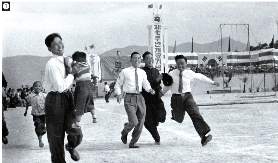
①우리학교의 '제1회 대동제'에서는 교직원과 학생, 지역 주민들이 함께하는 운동회가 열렸다.