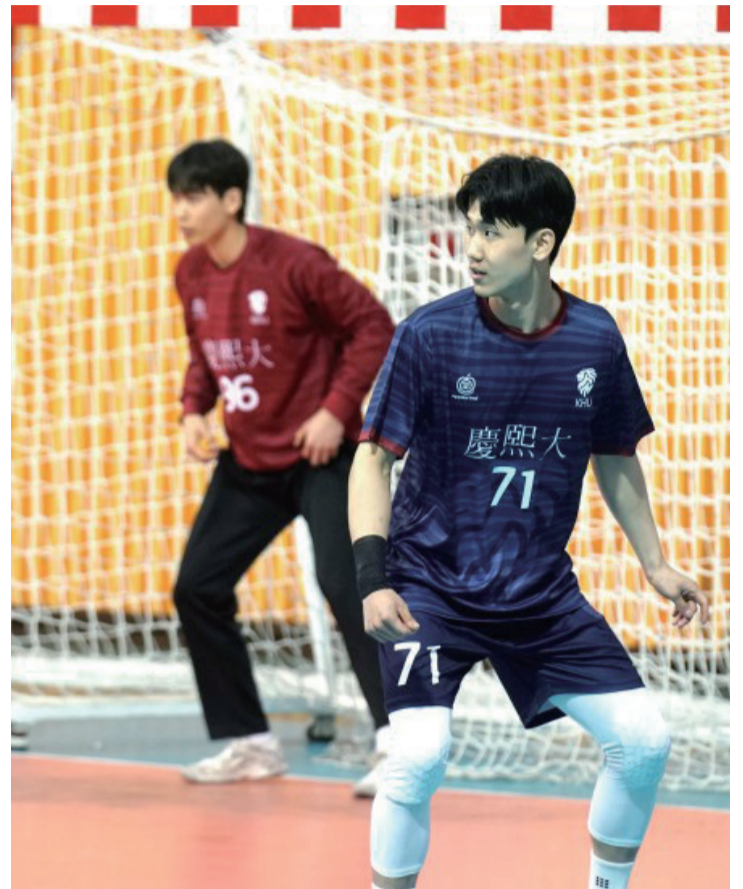
올해 '전 경기 무패'를 목표로 하는 핸드볼부는 지난 대회에 이어 '2026 H1 디비전리그'에서도 전승을 거두며 무패 행진을 이어가고 있다.