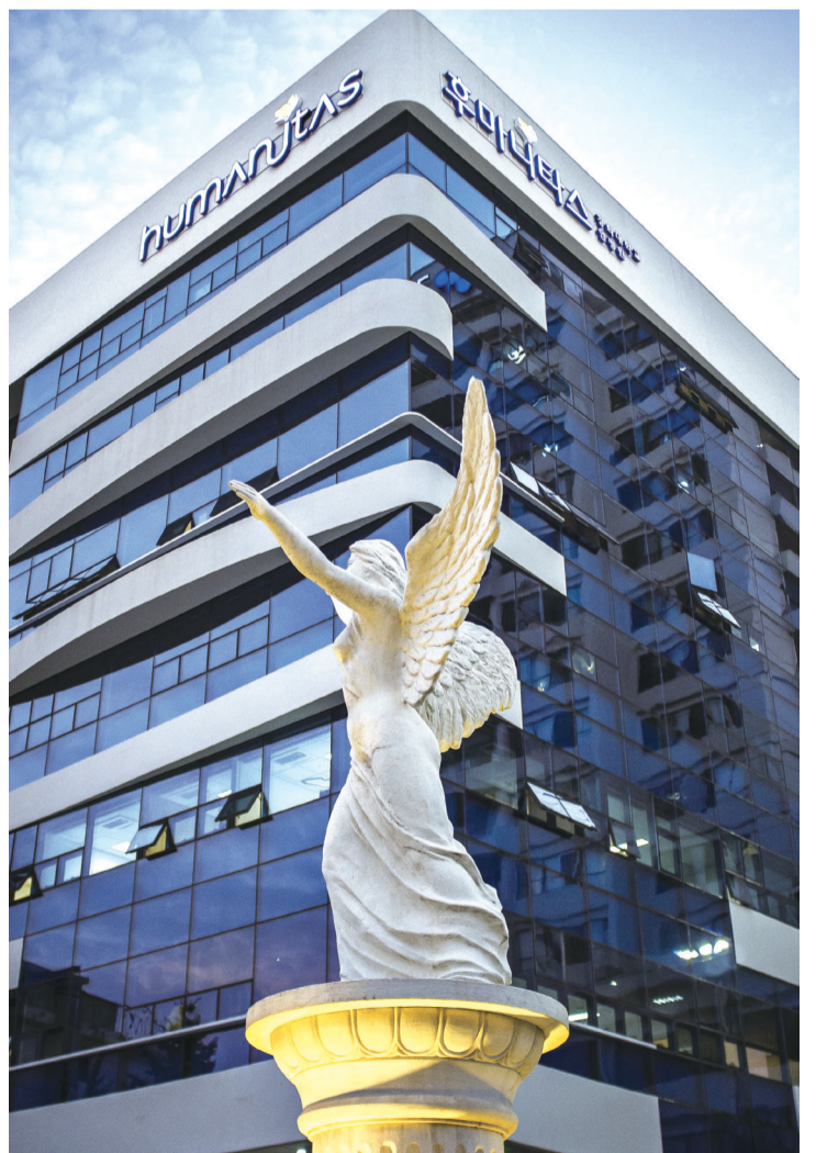
1971년 경희의료원 개원 당시 '건강의 여신상'의 모습. '니케의 여신상'을 모델로 했다.

벗어날 수 있는 건강한 사회를 이루는 것, 그것이 경희 의료가 지향하는 '질병 없는 인류 사회'의 모습이 라면, '건강의 여신상'은 그 꿈을 향한 경희 의료인의 의지와 도전을 상징한다고 할 수 있을 것이다. 그런데 설립자 조영식 박사로부터 새로 지을 병원의 조각상 제작을 의뢰받고, 작가가 이미지 구상에 실제 참고한 대상은 정작 히게이아가 아니었다고 한다. 모델이 된 것은 승리의 여신 니케를 조각한 헬레니즘 시대의 대표적 조각상 '사모트라케의 니케'였다. 바람에 날려 다리에 휘감긴 치맛자락이나 섬세한 두 날개의 모습을 바라보노라면, 니케 여신상이 연상되기도 한다. 의료원이 개원하기 3년 전인 1968년 완성된 이 조각상은 처음에는 병원 입구에 마련된 경비실 건물 위에 설치돼 있었다. 그러다가 2011년 경희의료원 개원 40주년을 맞아 잔디광장을 재정비하면서 경비실이 철거되고, 건강의 여신상도 지금의 위치에 이전 설치됐다.