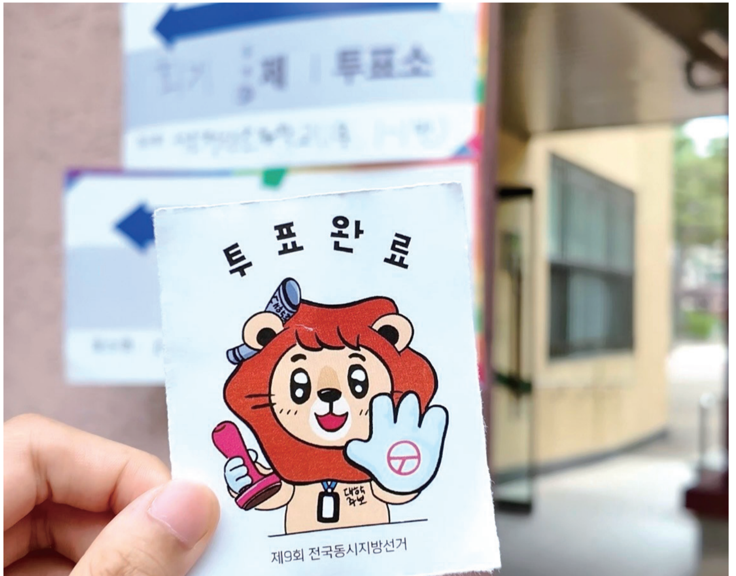
제9회 전국동시지방선거에서 청년 표심은 주요 변수 중 하나로 작용했다. 선거는 끝났지만 공약이 정책으로 이어지는 과정은 이제 시작이다.