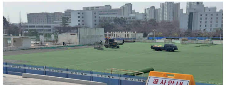
공대 지하 주차장 연결계단 3개 중 테니스장 좌측 2개가 폐쇄되며, 농구장 우측 1개소만 개방된다.